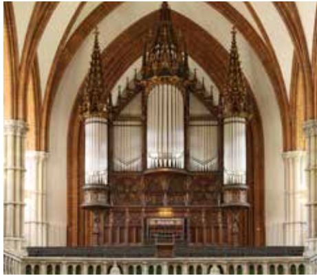
Chemnitz St.Petri