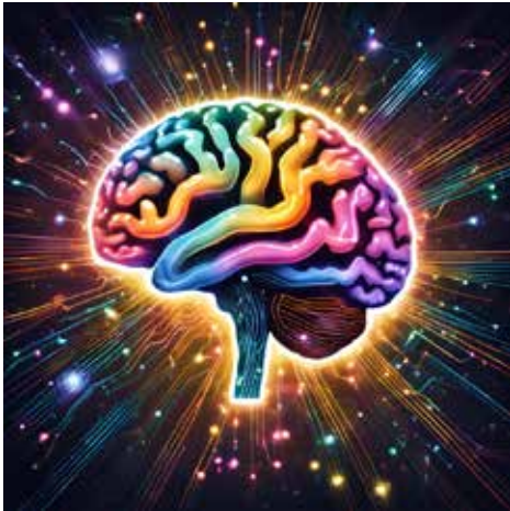
© Foto: KI-generiert